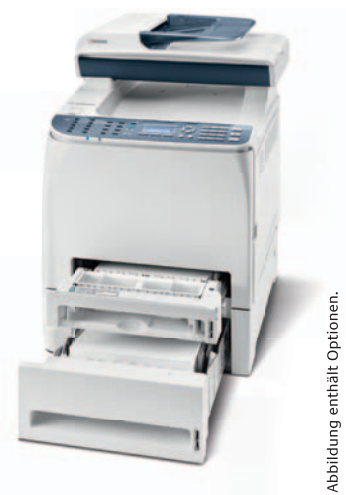
Abbildung enthält Optionen.